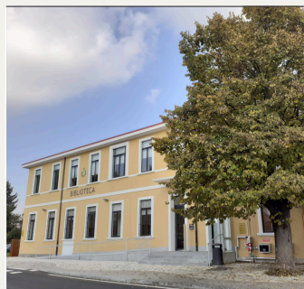
Biblioteca "G. Gerosa Brichetto"