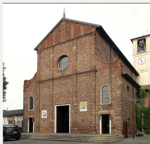
Chiesa parrocchiale di Linate