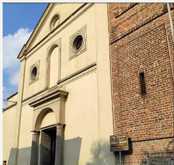
Chiesa di Mirazzano