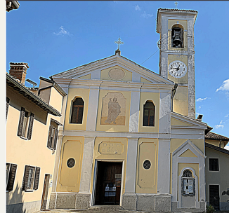
Chiesa parrocchiale di San Bovio