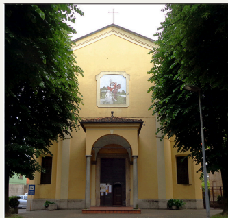
Chiesa di San Martino