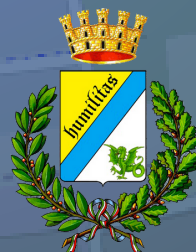
Città di Peschiera Borromeo